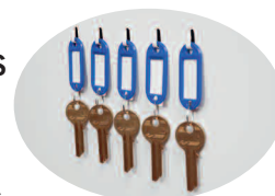
Colgadores internos para llaves