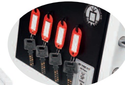
Colgadores internos para llaves