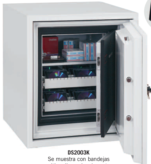
DS2003K Se muestra con bandejas multimedia opcionales extras